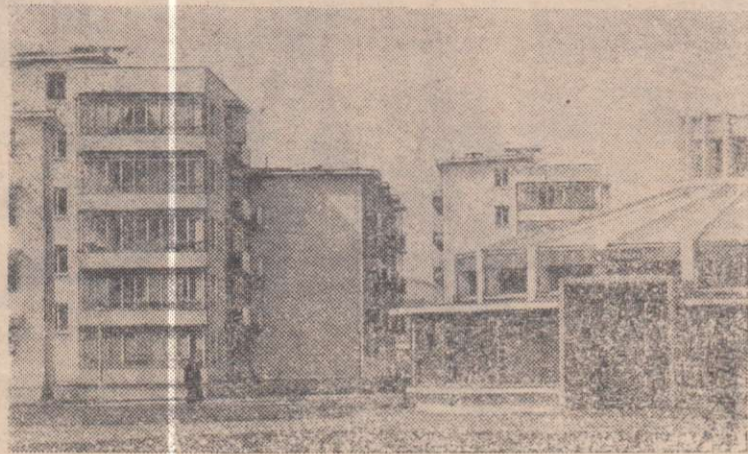
Хорошеет и благоустраивается Улан-Уатор. В жилых кварталах города много магазинов, предприятий бытового обслуживания, школ и больниц.