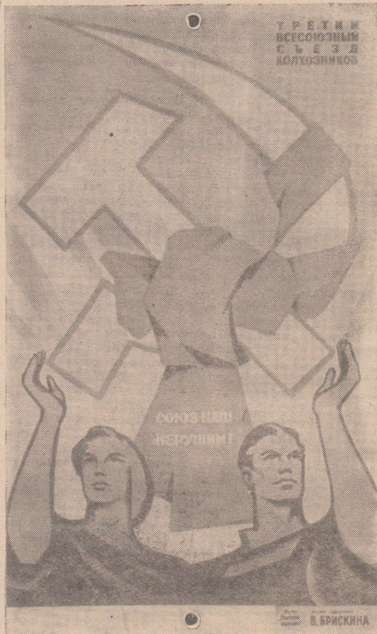
Плакат художника В. Брискина, выпущенный издательством «Советский художник» к Третьему Всесоюзному съезду колхозников.

Обязательства обсуждены и приняты на собрании механизаторов и инженерно-технических работников Дзержинского района.